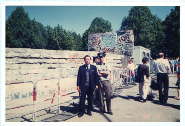
写真3 ベルリンの壁の前で(1990年5月1日撮影)

スター発表に興味をもち、その内容での講演依頼が届き、そして出席となった。1899年ベルリンの壁が崩壊したものの、当時はまだ東西に分かれており、本記念講演会は学問のペレストロイカとも呼ばれていた。学会前日の5月1日、ベルリンの壁の前で写真を撮ってもらおうと思い、そばにいた見知らぬ旅行者に頼んでじっとしていると、突然警察官と思わしき人物が近づいて来たので一瞬ハッとしたが、笑顔で一緒に撮ろうと言われ記念撮影をしたのがこの写真である(写真3)。そのお陰で、今後の旅行への不安感がいく分和らぎ、同時に東西ドイツの再統一への新しい時代の機運が動いていることを何となく肌で感じた。ハレまでの旅程は、まず東ドイツのF駅で列車に乗り、L駅で乗り換えのために降りた。L駅構内の二階にカフェテリアを見つけ、ウエイトレスが注文を取りに来たのでケーキ、ソーセージ、そしてコーヒーを頼む。時間が来て列車に乗り込み、ようやくハレ駅に着いた。翌朝、ホテルの窓を開けると、スモッグが立ち込め悪臭が鼻をついたことを覚えている。まだ陽が眩しい午後3時頃、ライブチツヒ通りを何となく歩いていると、路上に露店が立ち並び、時計、電気製品、香水、やけにピカピカ光沢のある洋服など何でも売っているが、本物はソーセージのみで、残りは偽物だという。また靴屋さんの前に行列ができていた。聞くと、西ドイツから靴が入荷し、それを購入するための順番待ちとのことである。私は、TBIIのバセドウ病予後判定の指標としての有用性について講演し、Basedow先生の素顔が描かれて